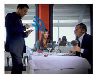
long range bluetooth