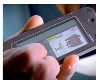
batterij gaat lang mee