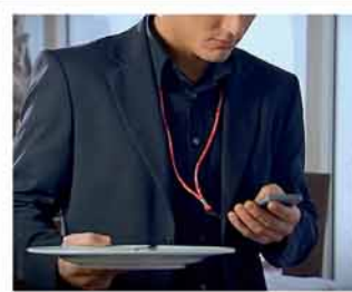
één hand bedienbaar